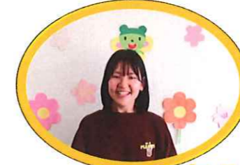
きくぐみ さかいあみ