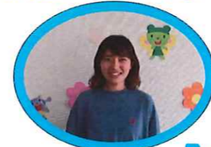
すずらんぐみ しらくまみさ