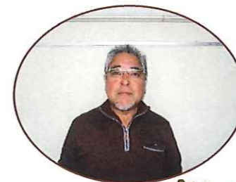
すぬーびーばす かなやまきいち