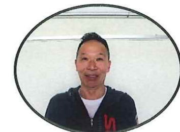
くらっしっくばす ますはらのぶゆき