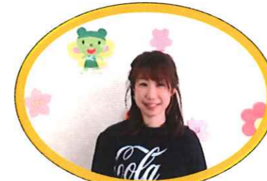
ぶれぐみ くぼまあや