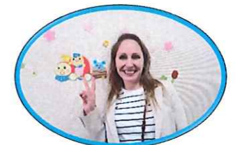
えいご みうらくりすていな